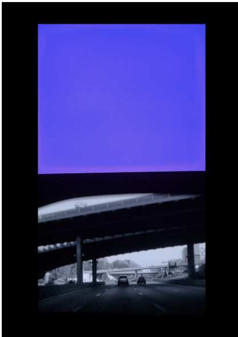
Chromiphérie , 2011, vidéo, couleur, 19 mn 40, édition 1/4. © Blaise Parmentier.