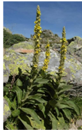
Molène thapsus , appelé aussi Bouillon blanc